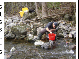
Échantillonnage du benthos de la rivière Bélaïr, COBARIC 2011

« Les macroinvertébrés benthiques sont des animaux sans colonne vertébrale, visibles à l'œil nu et qui se retrouvent au fond des cours d'eau et des lacs. Les larves d'insectes aquatiques ainsi que certains adultes, les crustacés, les vers et les mollusques sont des macroinvertébrés benthiques. Ces organismes sont largement utilisés pour évaluer la santé des lacs et des cours d'eau puisqu'ils possèdent plusieurs caractéristiques d'un bon indicateur de la santé d'un écosystème. » Guide du volontaire, Programme de surveillance des cours d'eau, Comité de valorisation de la rivière Beaurport, 2006.