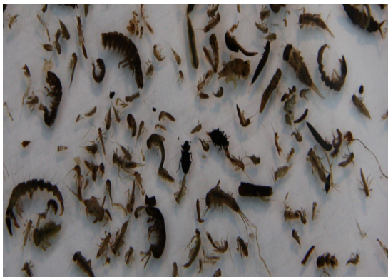
Tri du benthos pêché dans la rivière Bélaïr, COBARIC 2011

L'équipe du COBARIC a procédé à l'échantillonnage des insectes aquatiques dans la rivière Bélaïr, à Sainte-Marie, le 12 octobre dernier. Les résultats de l'analyse des échantillons recueillis seront connus cet hiver.