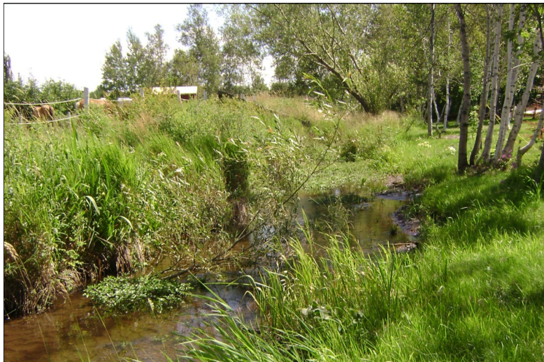
Rivière Cugnet, Saint-Lambert-de-Lauzon (COBARIC, 2012)

Ce projet vise d'abord et avant tout la protection, l'amélioration et la restauration de l'habitat de l'omble de fontaine à la tête de la rivière Cugnet à Saint-Lambert-de-Lauzon. Les aménagements qui seront réalisés contribueront à protéger la zone d'allopatie dans laquelle évolue cette espèce à la tête du bassin versant, à en améliorer le profil d'écoulement et les zones de fraie et à augmenter la population dans la rivière et ses tributaires.