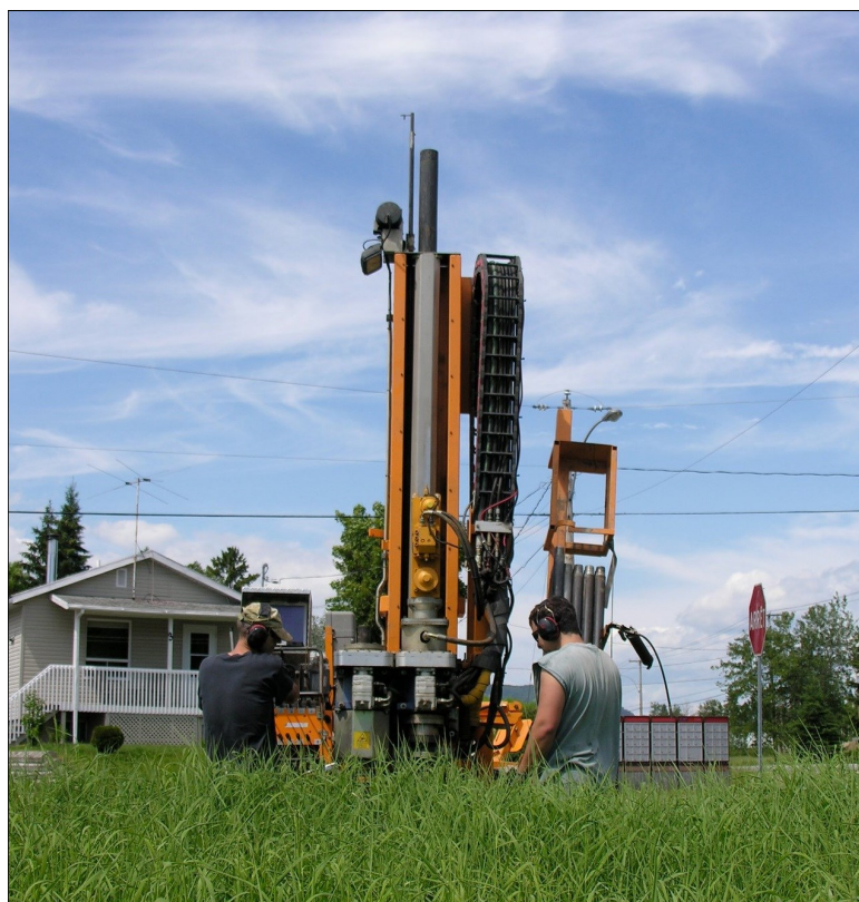
Forage dans les dépôts meubles et au roc (INRS, 2013)

Au niveau de la coordination régionale, les efforts ont été concentrés sur la collecte d'information en provenance des municipalités. Au total, plus de 200 rapports hydrogéologiques ont été obtenus et pourront être ajoutés à la base de données du projet. Près du deux tiers des municipalités de la région ont également répondu à un questionnaire sur leur utilisation de l'eau.