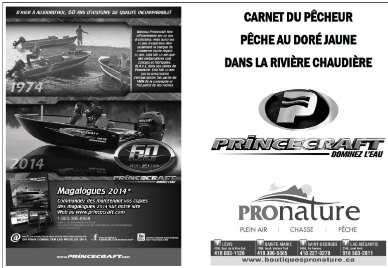
Carnet du pêcheur (COBARIC, 2014)

Depuis quelques années, l'état de la population du doré jaune dans la rivière Chaudière préoccupe les pêcheurs. C'est pourquoi le COBARIC, en collaboration avec les responsables du tournoi de pêche du Festival des travailleurs de Saint-Joseph-de-Beauce, lance un projet de caractérisation du doré jaune et des sites de frai dans le secteur de la rivière Chaudière situé entre les municipalités de Scott et Beauceville.