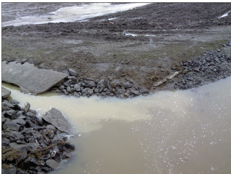
Bassin versant du Bras d'Henri (COBARIC, 2013)

Le projet pilote du Bras d'Henri réalisé au courant des derniers mois visait à déterminer le plus adéquatement possible les problématiques du bassin versant ainsi que les objectifs à atteindre afin d'améliorer la qualité de l'eau du Bras d'Henri. Ce projet s'étant terminé le 31 mars 2013, le COBARIC est fier d'annoncer sa poursuite afin de réaliser des aménagements concrets. Une rencontre de lancement aura lieu au cours de l'été et permettra aux producteurs de constater les aménagements déjà réalisés dans le cadre du projet d'Évaluation des pratiques de gestion bénéfiques à l'échelle des bassins hydrographiques (EPBH).