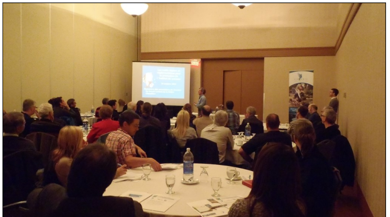
Cinquième édition de la rencontre des associations de riverains du bassin versant de la rivière Chaudière à Saint-Georges (COBARIC, 2013)

De plus, autre nouveauté, les municipalités étaient également conviées à se joindre au groupe afin d'échanger avec les associations de riverains et de bénéficier aussi des éclaircissements apportés par ces conférences.