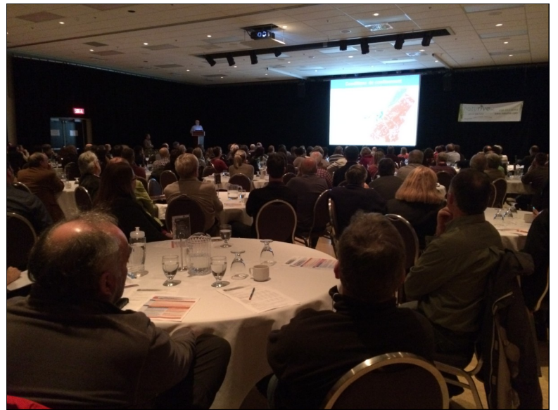
170 participants étaient présents, la plupart provenant du milieu municipal (OBV du Chêne, 2015)

Les neuf OBV de la Chaudière-Appalaches et le CRECA ont tenu le 10 décembre dernier à Saint-Agapit la quatrième édition du Forum régional sur l'eau où plus de 170 participants étaient présents, la plupart provenant du milieu municipal.